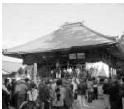
桜堂薬師での劇の発表

昨年度は、桜堂薬師の歴史を追究し、それを劇にして本堂で公開したり、市原の土人形を自分たちで調査し復活したり、土岐川のプロジェクトである『水辺の楽校』に、自分達の願いを提案したりする活動をしてきました。また、地域の方たちを招いて、郷土料理や祭り、踊りを学びました。民話を調べ大きな紙芝居も作りました。本年度は、土岐川の生物や虫が、校内のあちらこちらで飼育されています。土岐川の水環境調査や、清掃を行っている学級もあります。休み時間になると松洞川で魚取りに熱中している子どもも多くいます。これらの活動は学校にとどまら