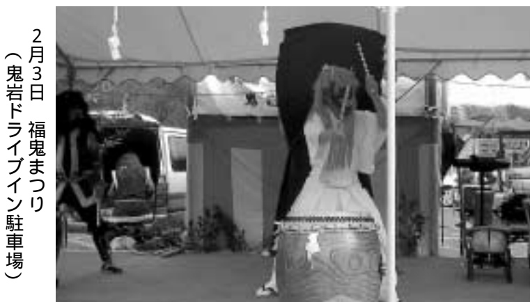
2月3日 福鬼まつり （鬼岩ドライブイン駐車場）