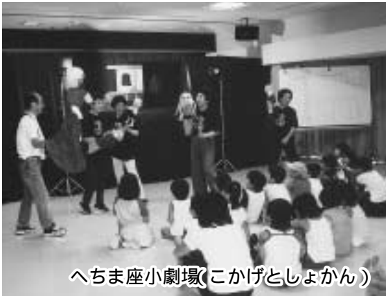
へちま座小劇場(こかげとしょかん)