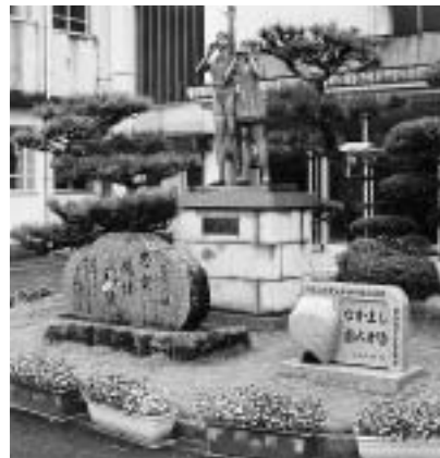
玄関前に立つ山びこ像

第1点目は、環境美化活動です。FBCの取り組みは様々ですが、それ以外にも町内のゴミ拾いをしたり、町内の施設へ花の苗や花かごをプレゼントしたりするなどの活動を進めてきました。