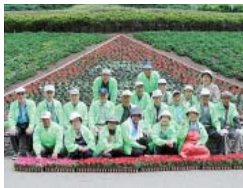
日吉花づくり同好会のきれいな花壇は必見です（開期中はいつでもご覧になれます）