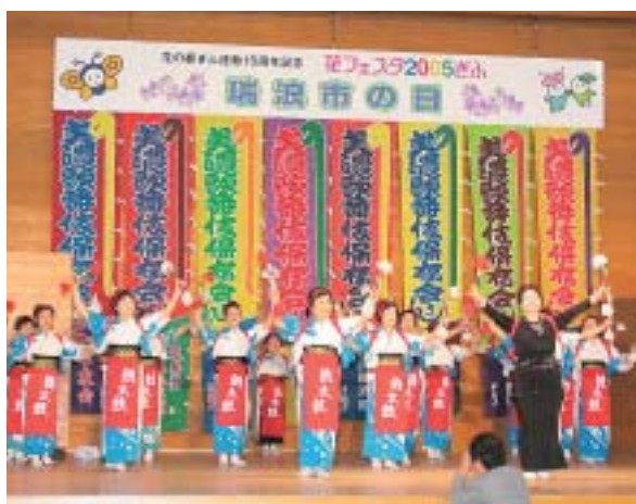
楽しそうに「サンバ」を踊る瑞津流銭太鼓愛好会の皆さん