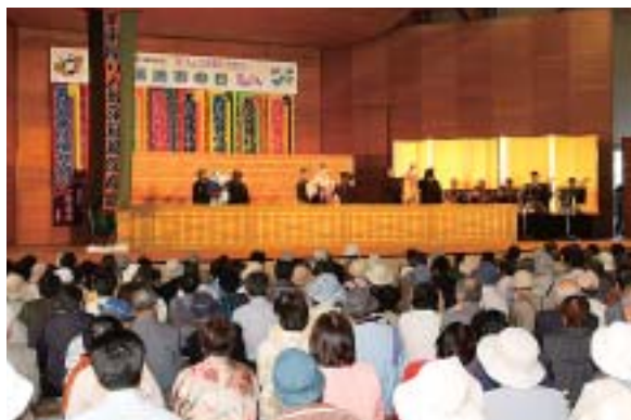
多くの人で埋め尽くされた会場