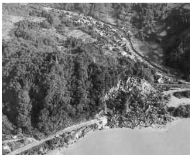
地すべりで車が巻き込まれた現場（小千谷市県道）

新潟県川口町は、わずか40分の間に、震度6強から7の直下型地震に3回も襲われました。いつ、どこに起こっても不思議でない地震に備えるには、家屋だけでなく室内の安全も大切です。