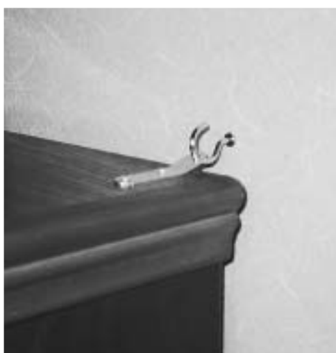
コンクリート壁に固定したタンス 壁に小さなPCプラグを左右2箇所に埋め込み、 取り外し可能な金具でとめた。

棚にある重量物は危険です。滑って落下すれば花瓶や額などと違い大怪我のもとです。スーパードに行けば、騒音防止や滑り止めなど、いろいろな商品がありますが、防災グッズのコーナーにはなくても、安価で十分役立つものが市販されています。