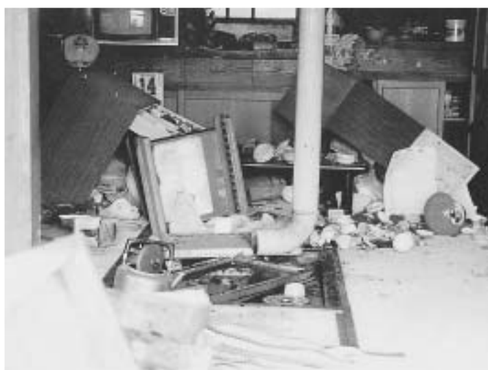
1984年長野県西部地震（M6.8） 玉滝村 家具散乱（棚は二つに別れて転倒）

まず直下型大地震の可能性です。瑞浪市やその周辺には心配されるような活断層はありません。歴史的にも東濃地域の被害地震は知られていません。1827年の三条地震、明治以降にも度々被害地震が起きている信濃川流域とは大きな違いがあります。最近の研究で信濃川流域の地殻ひずみは大きく、東濃では小さいことが判りました。したがって、直下型地震の確率は低いのですが、決してゼロではありません。まさかと思っていた御岳の地震や三河地震はマグニチュード6.8でした。地震はどこに起こっても