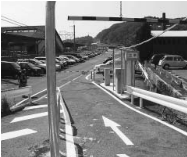
中心市街地活性化支援施設整備事業( 駅北駐車場)