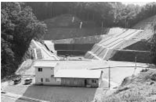
新不燃物埋立処分場建設事業

平成15年度決算については、12月市議会定例会に提出され承認されました。 一般会計の歳出総額は164億1,016万円、前年比9億7,100万円、6.3%の増となりました。これは主に、新しい不燃物埋立処分場の建設の開始及び、上平山田団地線をはじめとする道路の改良・補修を行なったことによるためです。 財政状況は依然として厳しい状況にありますが、必要となる生活環境基盤の整備や教育・福祉事業の推進を図り、市民一人ひとりが快適に暮らせるまちづくりに努めていきます。