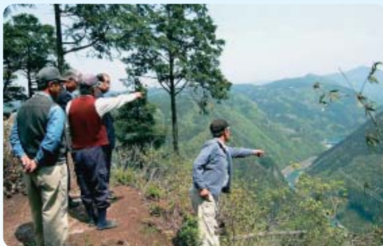
4月 天狗塚展望台完成(日吉町)