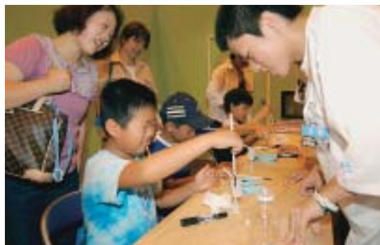
7月 「おもしろ科学館inみずなみ2004」開催