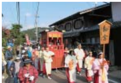
11月 姫街道まつり開催