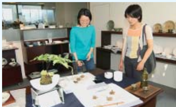
7月 「ミスナミデザインショップ」オープン