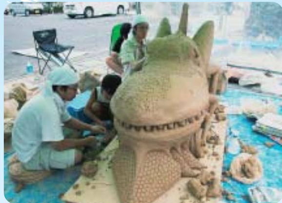
8月 クレイオブジェコンテスト