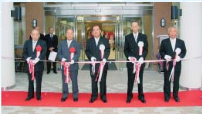
9月 陶コミュニティセンター(陶公民館)完成