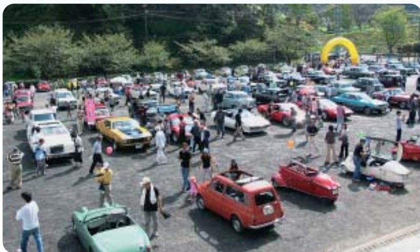
10月 クラシックカーフェスティバル開催