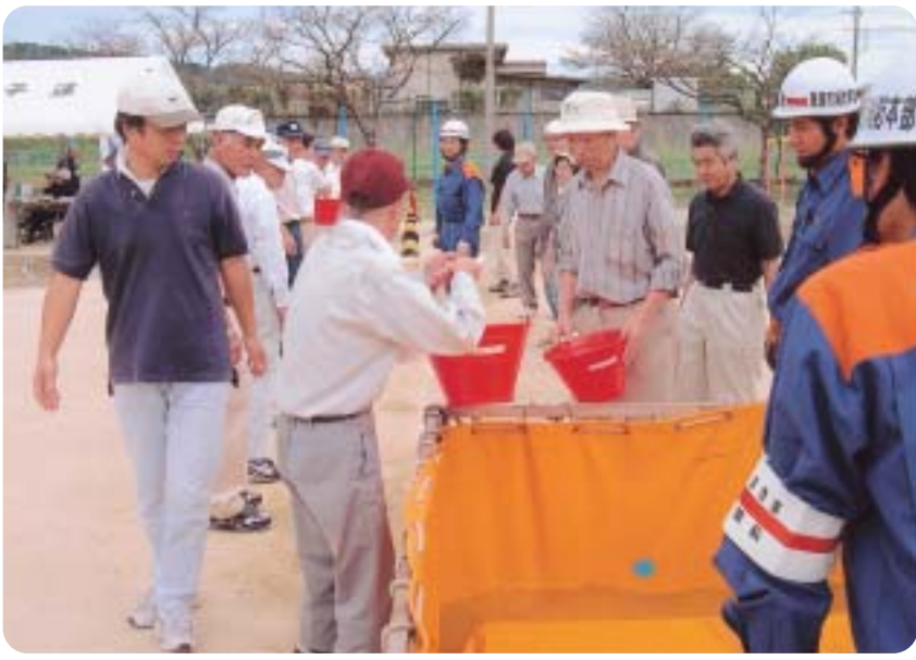
土岐地区自主防災組織リーダー養成防災訓練（H16.8.29）