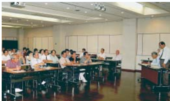
6月 「市長と語る会」開催(8地区)