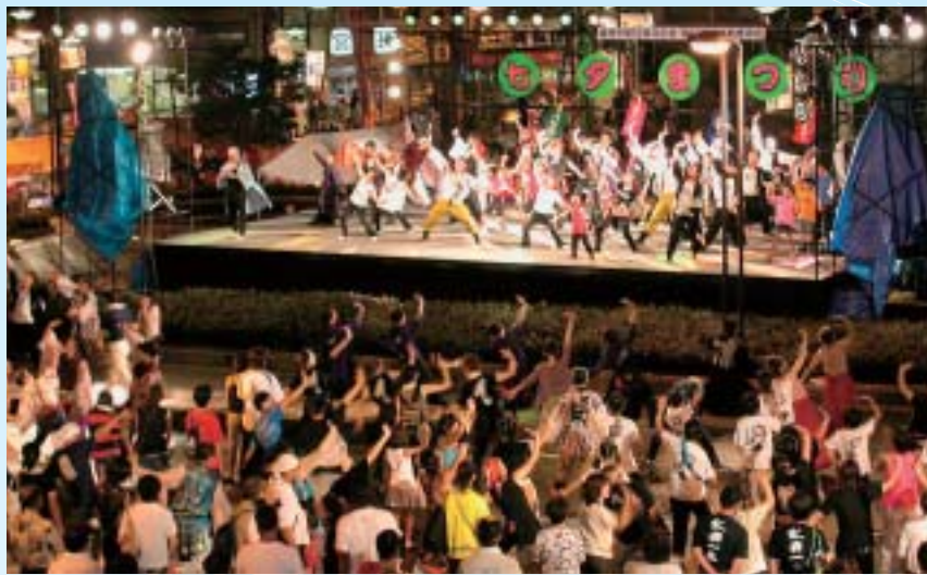
8月 第45回美濃源氏七夕まつり