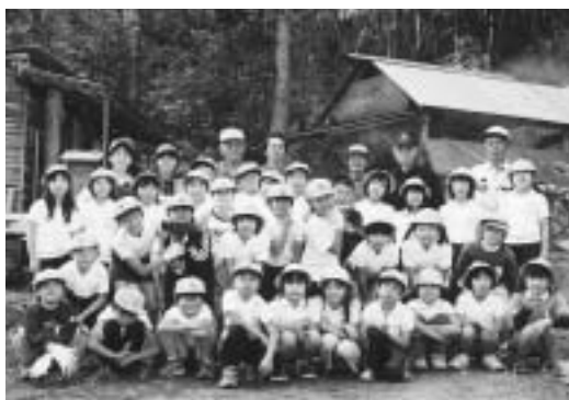
陶小学校3年生と炭焼き小屋の前で

子も積極的にやっています。最後に屑炭を集めて起こした火で芋や栗を焼いて食べながら楽しく反省会をして終わりました。 平成17年には大湫岳見高原キャンプ場に炭焼き窯を築き、「炭焼き体験コーナー」の指導に携わっています。