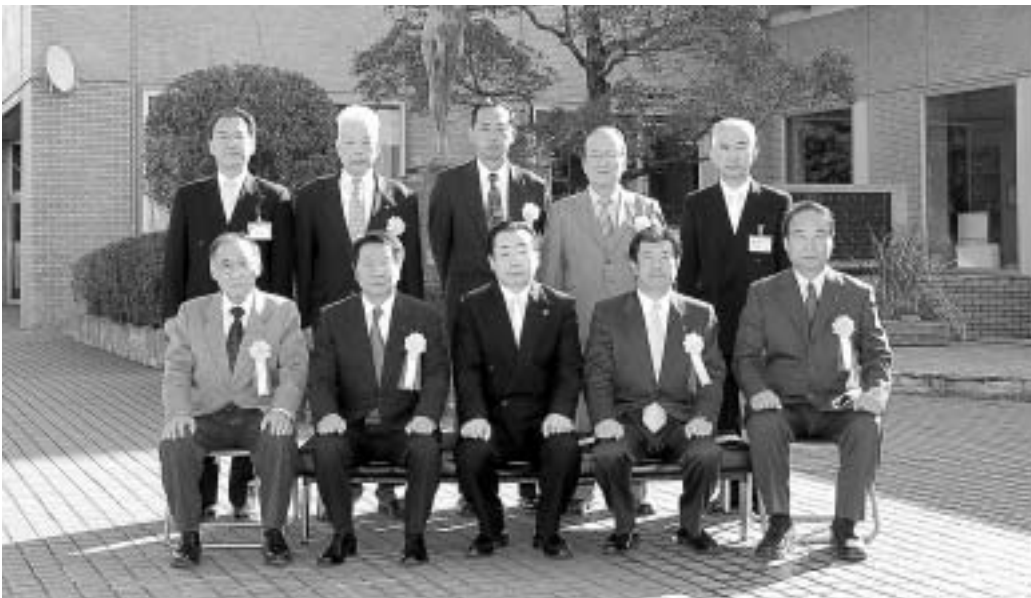
感謝状を受けられた皆さん