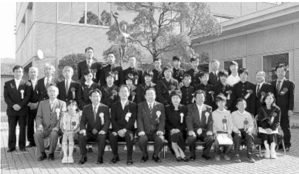
教育功労者表彰を受けられた皆さん