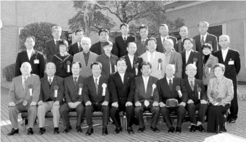
瑞浪市功労者表彰を受けられた皆さん