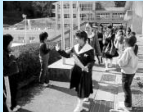
卒業式では小学生も一緒に見送り

示そつと、小学校玄関でのあいさつ運動や中庭での合唱発表、小学生を招待しての図書館講座など、アイデアを出し合って交流を進めています。先月は、三年生が小学校の教室を訪問して歯磨き指導を行いました。お兄さんお姉さんとして、正しい歯磨きの仕方を教えながら、ほほえましい時間を過ごすことができました。