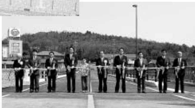
和合橋完成(平成15年3月)

瑞浪市には市民病院がありません。そのため、当時の昭和病院を地域中核病院として位置づける中、病院改築のため9億円を助成しました。平成15年からは「東濃厚生病院」として地域医療に取り組んでいただいております。 また、「水道の無い地域に上水道整備を」と始めた未給水地域解消事業も、平成10年から85億円の事業費をかけて、この平成19年度で96%が完成します。