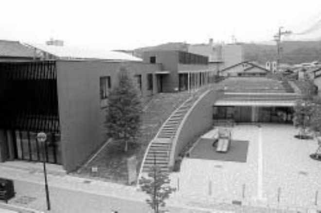
地域交流センター「ときわ」完成(平成19年7月)