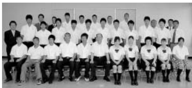
【中京高】ソフトテニスや新体操など12種目で出場