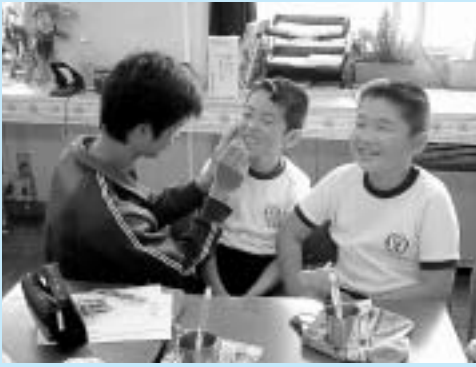
正しい歯磨きの仕方を教えます