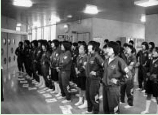
くり返し発声練習に取り組む姿

釜戸中学校では、教育活動の一つの柱として、全校をあげて「心で歌う」合唱活動に取り組んでいます。朝の会の前から、発声練習が始まり、帰りの会も含め、合唱委員がリーダーとなり、美しい歌声を創っています。また定期的に校内で合唱交流会を行い、学年の枠を越えて、全校合唱の質の向上に努めています。3年生の市音楽会への参加はもちろんです、10月末には釜戸小学校との合同音楽会、1月末には釜中合唱祭において、創り上げた合唱を発表しています。多数の保護者や地域の方々に参観