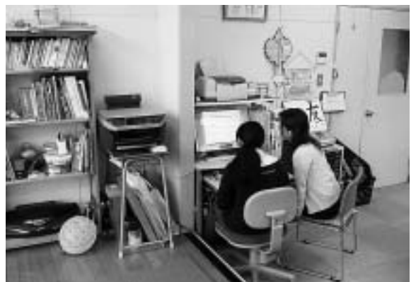
パソコンを使っでの学習