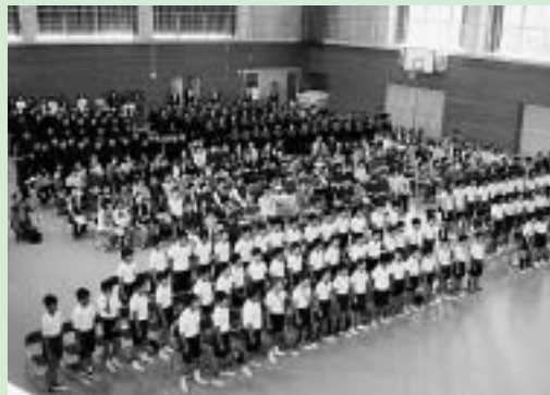
合同音楽会での大合唱

いただき、応援をいただいていることが、生徒にとって大きな励みになっていきます。昨年11月の市の音楽会で、合唱委員長が「釜中の合唱は、ただ歌うだけの合唱ではありません。心で歌う合唱です」と語り、言葉どおりの心に染み入る合唱を披露しました。このビデオは校内で放送され、全校生徒の共通の目標になっています。美しい歌声づくりを通して、豊かな心、思いやりの心をいっそう伸ばし、学校の宝である「合唱」を、これからも伝統としてつないでいきたいと思えます。