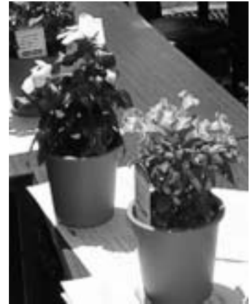
飲料水をつくるときに出る泥土を利用したポット花