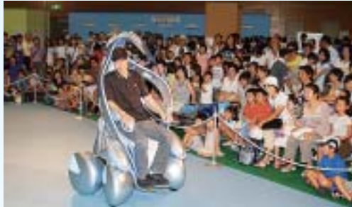
▲ 8月 「おもしろ科学館2006inみずなみ」開催