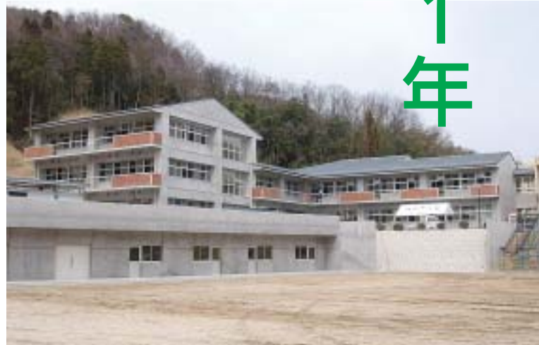
▲ 3月 日吉中学校新校舎完成