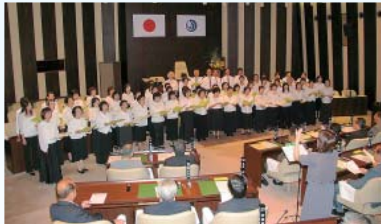
▲ 9月 「第1回議場コンサート」開催