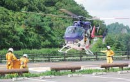
▲ 8月 小里川ダムヘリポート