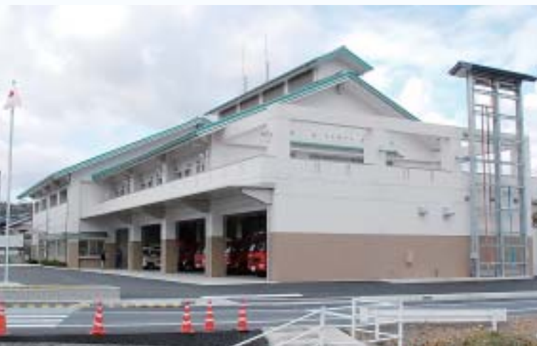
▲ 12月 総合消防防災センター完成