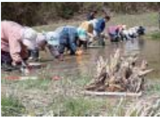
◀ 4月 マコモタケ試験栽培開始