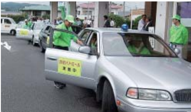
▲ 7月 青色回転灯による防犯パトロール開始