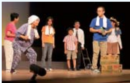
▲ 9月 市民劇団 「みずなみルネッサンス」 公演