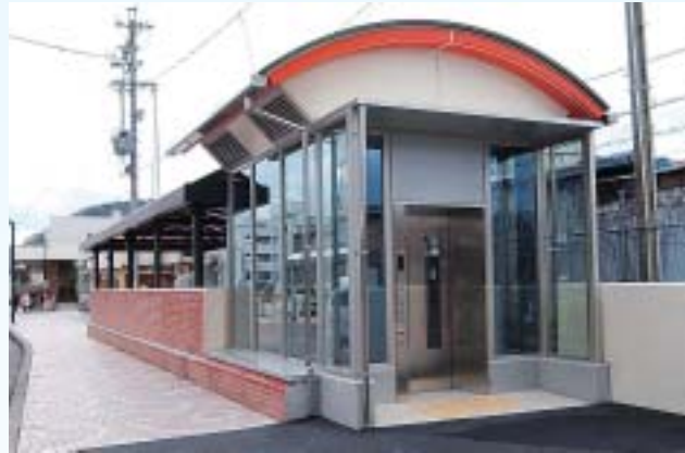
▲ 3月 駅地下道にエレベーター設置