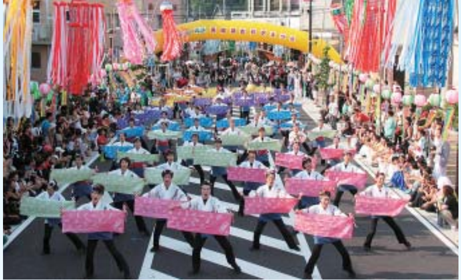
▲ 8月 「第47回美濃源氏七夕まつり」開催