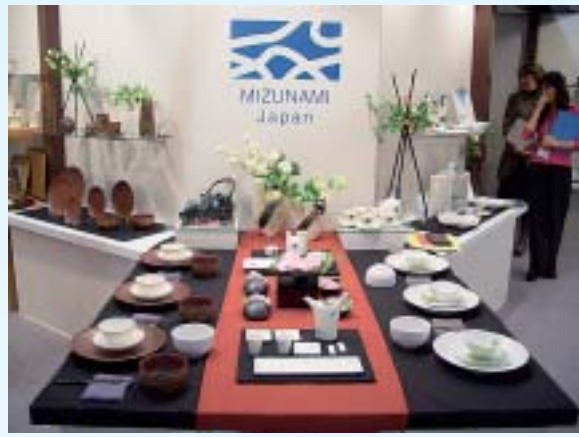
▲ 2月 みずなみ焼「フランクフルト・メッセ」出展