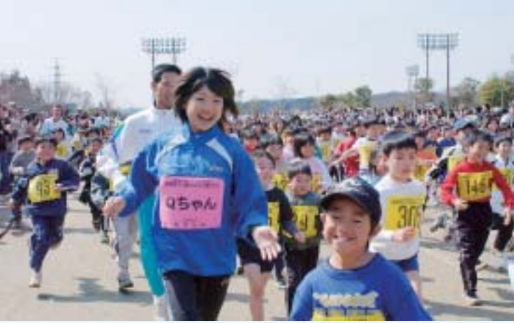
▲ 3月 「Qちゃんと走ろう」開催