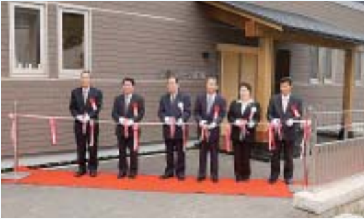
▲ 3月 市民弓道場完成