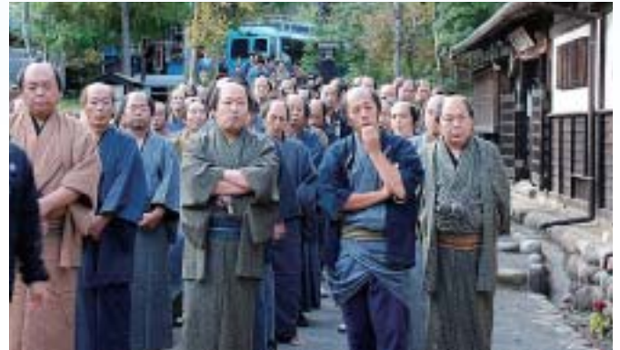
▲ 10月 19年秋公開の時代劇「やしきた道中てれすこ」 相生座で市民100人参加し撮影