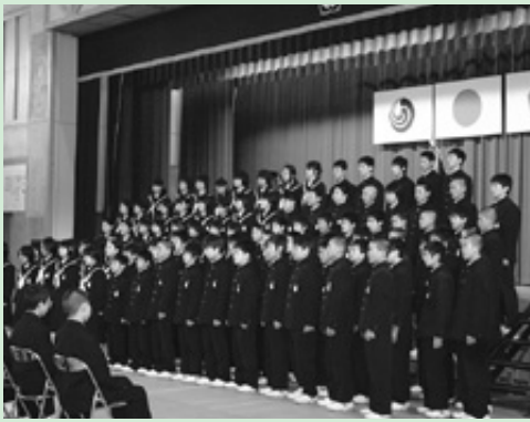
2・3年生による歓迎合唱

入学式の後の対面式では、生徒会長が、「あいさつ・授業・合唱の三本柱に力を入れていきます。同じ仲間としてがんばりましょう」と歓迎の言葉を述べ、