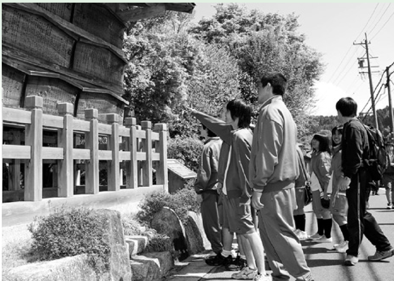
「瑞浪で学び、瑞浪を学ぶ」文化財いっぱいの中산道を歩く 中京高生の体験学習(4月25日 大湫町)