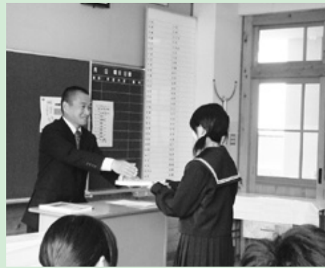
担任より進級論文集を手渡す