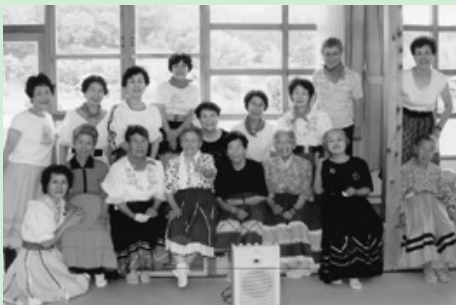
日吉町「福寿荘」の皆さんと

90歳のお年寄りに「こんな楽しいことはないよ」と喜んでいただき、訪問した私たちが励まされ、とても嬉しい気持ちで帰途についたこともありました。