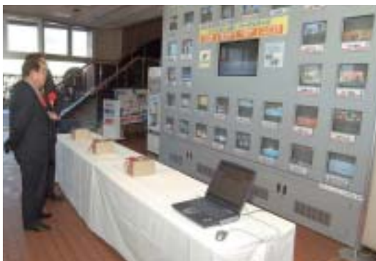
ケーブルテレビサービス開始