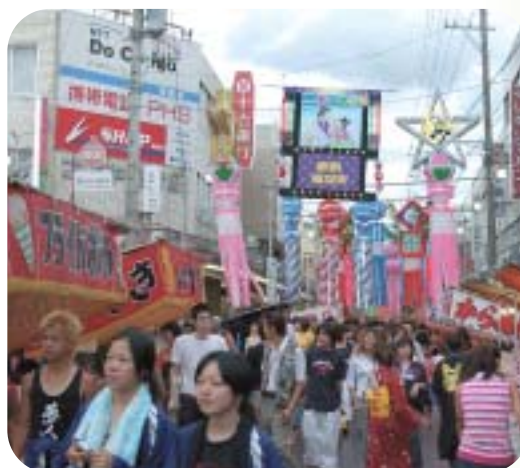
第44回美濃源氏七夕まつり