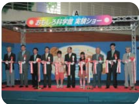
おもしろ科学館inみずなみ