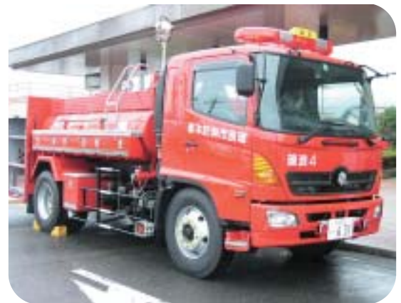
消防本部給水車導入