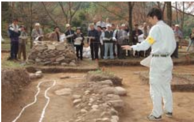
小里城跡発掘調査現地説明会