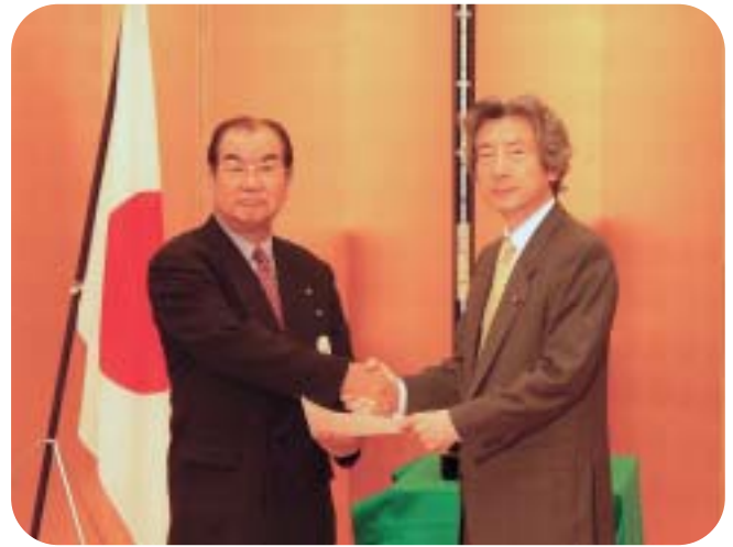
幼児教保育特区計画の認定書授与式