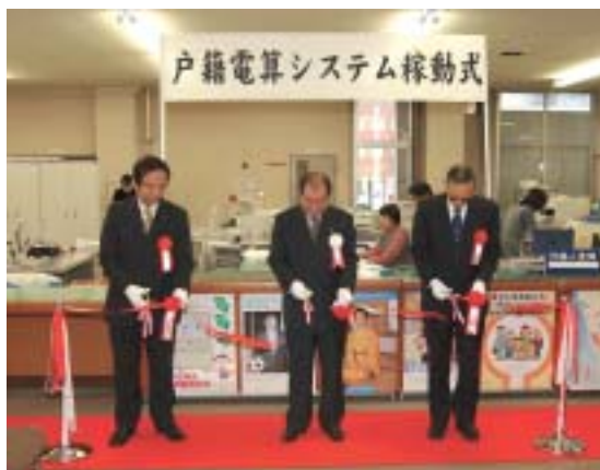
戸籍事務電算化開始