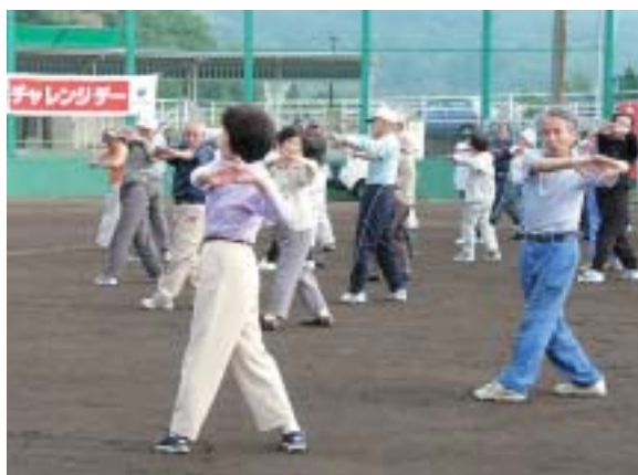
チャレンジデーinみずなみ