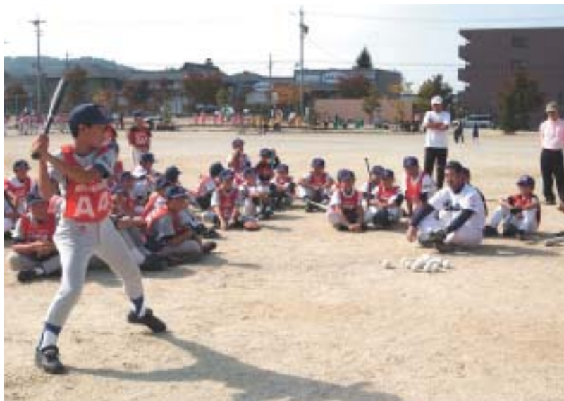
スポーツ少年団野球教室