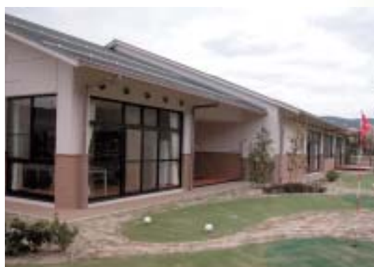
「桜寿荘」「さくら」オープン