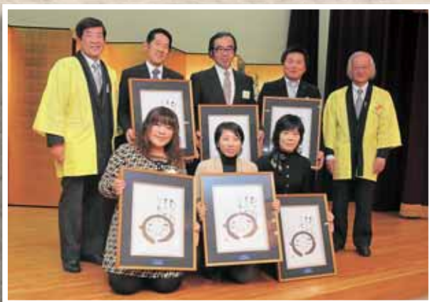
良い「縁」「宴」「円」で、瑞浪を元気に

互礼会では、まちづくりに貢献した団体や個人に贈られる「快適空間賞」の授与式も行われ、6の団体・個人が表彰されました。