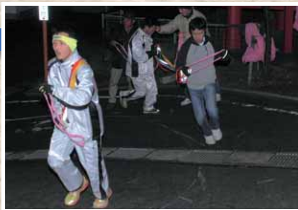
健康と幸福を祈って

この大会は、午前0時30分に日吉神社をスタートし、山田八幡神社など地区内5箇所の神社を初詣しながら約6kmを走ります。参加した約350名は、思い思いのペースで今年最初の爽やかな汗をかいていました。