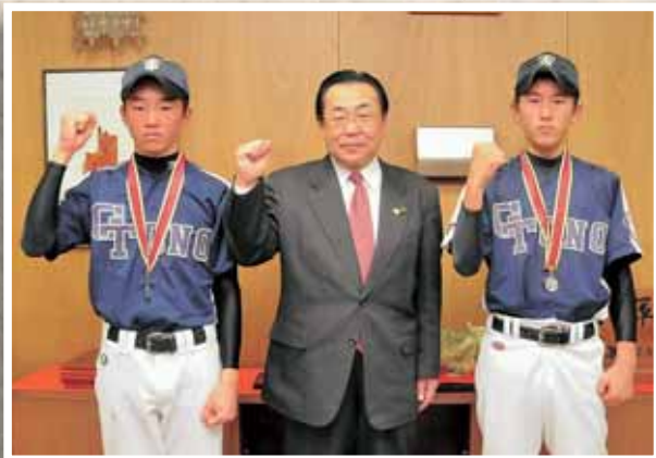
活躍を期待しています