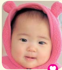
かつ うたねちゃん 勝 うたねちゃん 2月9日生 陶町