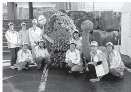
ボランティアの皆さんが制作したミナモと恐竜のトピアリー(立体飾花)