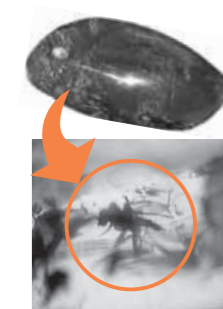
コハク中の昆虫化石

12月のイベント 12月9日(日) みずなみ化石教室 半日コースのみ開催します。