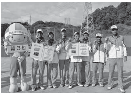
3位入賞の岐阜県チーム(少年男子の部)

素晴らしい力と技で私たちに感動を与えてくれた選手、それを支えた競技関係者、大会の運営にご協力いただいた大会役員やボランティアの皆さん。そして熱い声援で選手や会場を大いに盛り上げてくださった観客の皆さん、本当にありがとうございました。