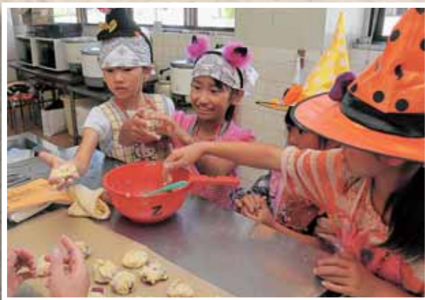
ハロウィングッズで、心もうきうき