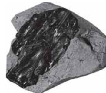
釜戸層から産出したコハク

また、同じ地層からマングローブ植物の花化石が見つかっています。瑞浪のコハクは、マングローブが生い茂るような熱帯の気候のもとでできたものと考えられています。