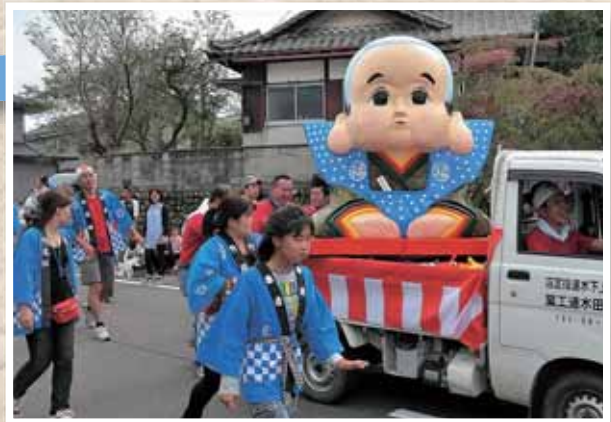
インパクト抜群！みんな振り返ります

秋祭りでは毎年祭り元が趣向を凝らして各組を練り歩くことになっており、今年は竹尾組の延べ150人が4カ月かけて製作した巨大みこしが、福を振りまきました。