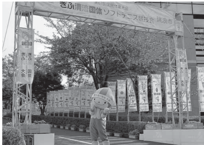
会場には市内小・中学生が作成した「応援のぼり旗」「飾花プラント」が装飾され、選手・監督を出迎えました