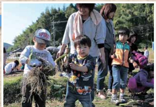
大きいイモがとれたね！

当日の朝、公民館近くの畑でサトイモやサツマイモなどを収穫し、そのままサトイモ入りの豚汁や石焼いもを作り、会場は良い香りと笑顔に包まれました。