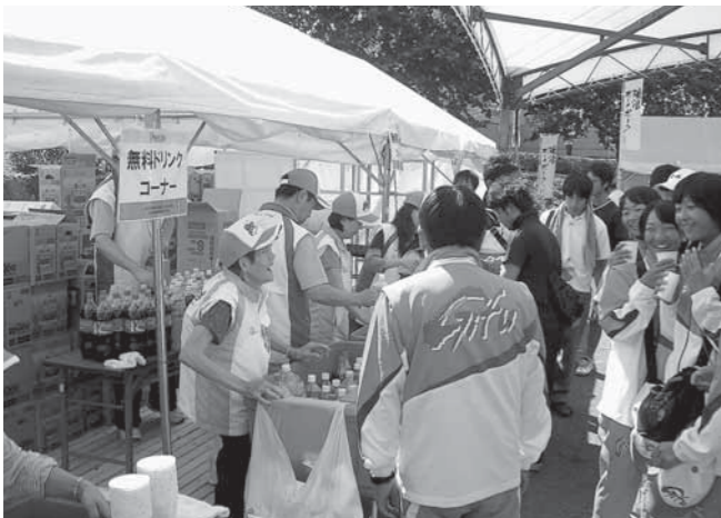
ボランティアの皆さんによるドリンクのサービス。全国から訪れた選手・観覧者とふれあいました