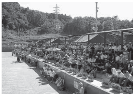
大勢の皆さんが来場し、選手に大きな声援を送っていました