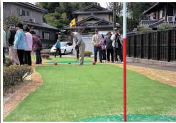
健康増進のため、ぜひご利用ください！