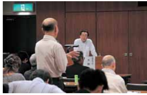
▲昨年度の地域懇談会のようす

今年度の地域懇談会は、第6次総合計画の策定状況について報告するとともに、「みんなで考える人口減少社会」をテーマとして、瑞浪市の大きな課題である「人口減少」を抑制するためのアイデアなどについてお聞かせいただきたいと思っております。市民の皆さんのご参加をお待ちしています。 また、幅広くご意見をいただきたいと考えており、各種団体などの方々と懇談会も開催してまいりますので、ご希望がございましたら下記までご連絡ください。