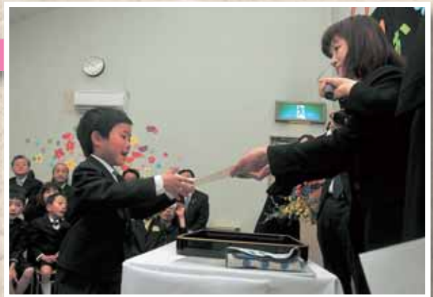
小学校へ行ってもがんばってね

土岐町の養護訓練センターで平成24年度修了式が行われ、小学校へ入学する17人に修了証が授与されました。現在の養護訓練センターは、4月から瑞浪駅北の施設「ほけっと」へ移転することが決まっており、この施設で行われる修了式も最後となり、職員、通所者の皆さんも名残り惜しそうです。