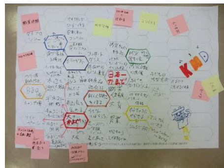
連想ゲーム形式によるアイデア出しの結果