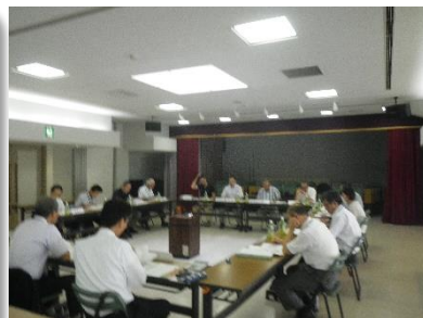
検討委員会の様子