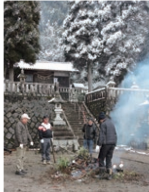
鶴城 1/12(月) 諏訪神社境内