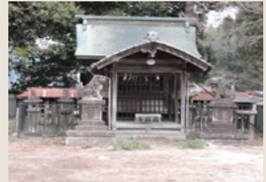
櫻堂薬師本堂南の櫻宮神社

⑨ オマントウ（オマント・お馬頭・お馬の塔）馬の背に神霊の依り代となる飾りを載せ、飾り馬具をつけて奉納する「馬の塔」という祭礼が、主に愛知県を中心に伝わっています。現在では、その飾り自体を「オマントウ」と呼ぶようになっているようです（関連インターネットサイトより）。