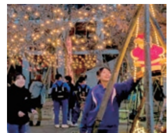
イルミネーションで美しく飾られた北中体育館前の中庭広場