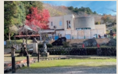
回り舞台解体後の寺社境内