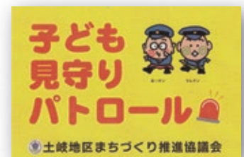
車の後部窓ガラスに内側から貼ることができます

事務室までお越しいただくか、下記の電話番号へお問い合わせいただければ、郵送でも対応します。