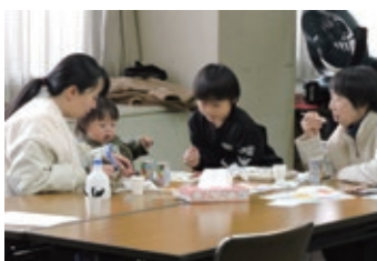
家族で非常食を試食して意見交流

今回の体験学習は、いつ起こるかわからない災害に備えるうえで、参加者にとって大変有意義な機会となりました。