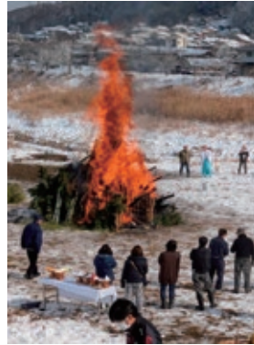
柴町 1/12(月) 消防署横河川敷