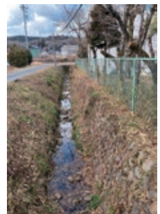
水面が全く見えなかった松洞川がすっきりと美しくなりました