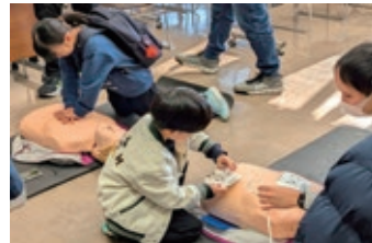
自動体外式除細動器（AED）体験