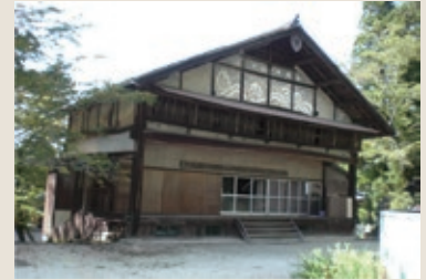
解体前の櫻宮神社回り舞台