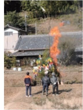
清水 1/18(日) 下街道南の農道