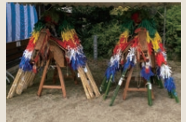
オマントウ