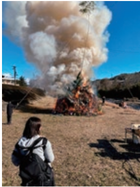
一日市場 1/11(日) 日焼田橋下河川敷

どんどでは、門松やしめ縄などのお正月飾り、古いお札やお守り、書き初めなどを持ち寄って燃やします。正月飾りでお迎えした年神様（歳神様）を、炎とともにお見送りするという意味が込められています。燃やした火で焼いたお餅や団子を食べると、その一年を無病息災で過ごせると言われています。また、書き初めや勉強のノートを燃やし、炎が高く上がるほど学業が上達すると信じられています。さらに、家内安全・火災除けの願いを込めて、灰を持ち帰り家の周囲に撒くと、病気や災いを避ける効果があるとされています。しかし近年では、門松作りの風習が薄れ材料が手に入りにくくなったことや、どんど行事の意味や作り方の伝承が難しくなっていることから行事を取りやめる地域も増えています。日本の精神文化が少しずつ失われていくのは寂しいものです。