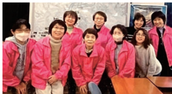
土岐地区更生保護女性の会の皆さん