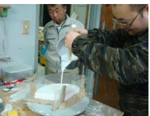
石膏を流しいれる