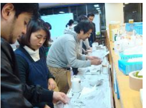
原料を正確に計る