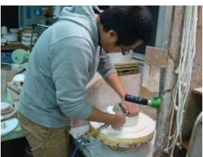
エアーを使ってはずす