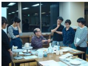
筆の持ち方について

内容: 絵付けの基本となる“骨描き+ダミ”について学び、平物、立ち物に加飾を施す。