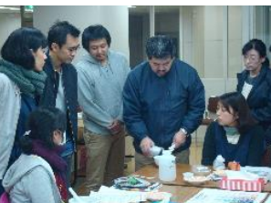
乳鉢で原料を摺る