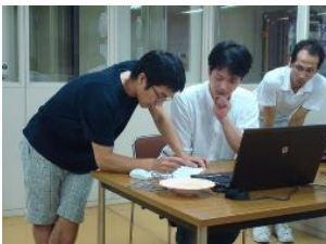
形状をスケッチで確認