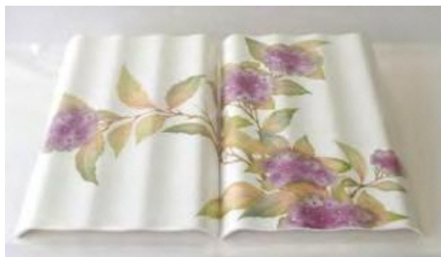
憩いの一時（1991年） 結晶化ガラスに上絵吹き加飾したインテリア製品