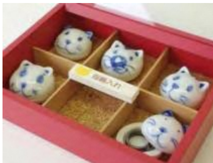
指輪入れ（2003年） ハット愛好家向け商品の提案