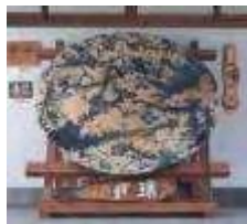
世界一の大皿 1996年 稲津町