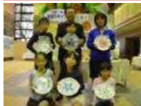
児童・生徒食器デザイン展の開催 1996年から