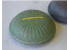
通気性セラミック型の開発 1983年から