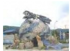
ドラゴン21 2001年 釜戸町