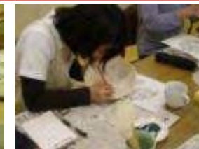
伝統技術伝承事業 2010年から