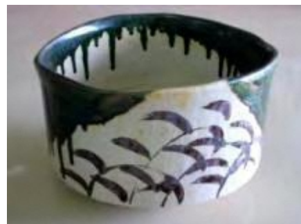
軽量粘土（2008年） 陶芸教室向け軽量粘土の開発

〒509-6122 岐阜県瑞浪市上平町5-5-1 TEL: 0572-67-2427