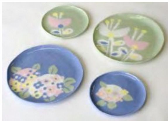
花柄文様練込皿（1992年） 色土のシート状粘土と花柄文様をプレス成形