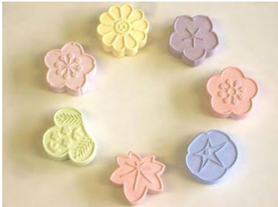
香りをたのしむ和風小物（アロマストーン）（2013年） 「舞妓の花かんざし」を題材にした四季折々のアロマストーン