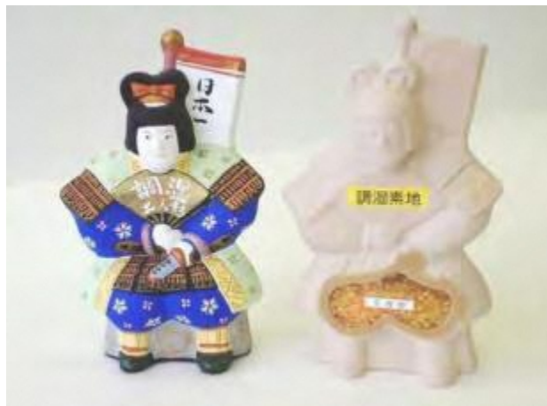
調湿瑞浪土人形（2011年） 調湿する素地で作った伝統的な土人形