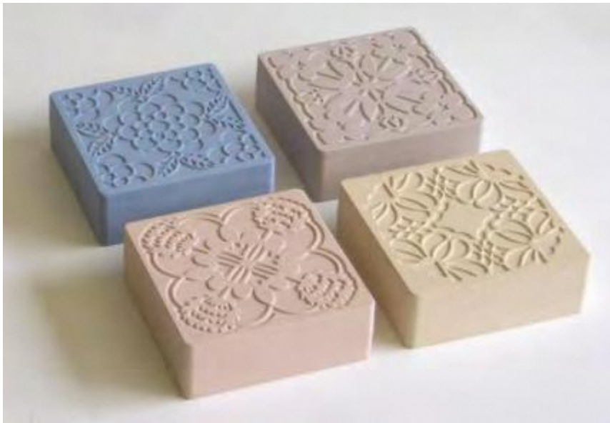
香るブロック（2012年） 廃棄する釉薬を利用した粘土で成形したインテリア商品