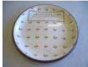
ラバーハット直接印刷機の開発 1980年