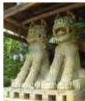
世界一のごま犬 1990年 陶町