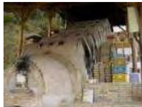
陶与左衛門窯 2006年 陶町