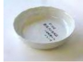
大型湿式プレス樹脂型の開発 1991年