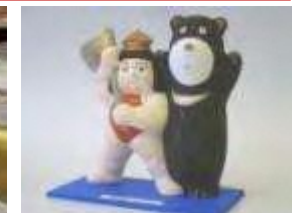
3D技術で瑞浪土人形制作 2009年