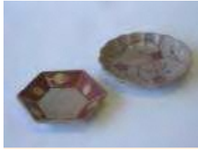
プレス成形樹脂型の開発 1987年から