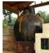
世界一の茶つぼ 1999年 陶町