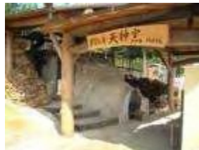
学習工房 天神窯 2003年 日吉町