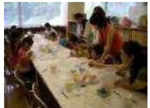
絵付け体験や作陶教室の開催