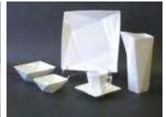
海外マーケット向けの商品開発 2001年