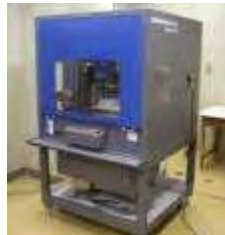
3次元CADと切削加工機によるデザイン開発と試作支援 2006年から