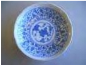
自動凹版転写印刷機の開発 1972年から