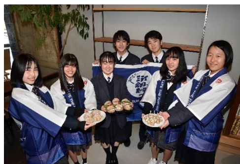
ミライ創ろまい課 活動の様子