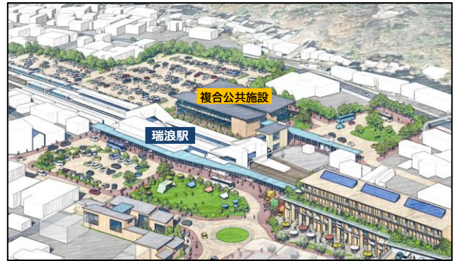
瑞浪駅周辺まちづくりイメージ図

駅北地区では、既存の文化センターのホール機能や図書館等を集約し、市民ニーズに合わせた機能を追加した公共施設の整備を行い、駅南地区では、市街地再開発事業による住居・商業施設の入ったビルや、まちなみを整備し、将来にわたり活気と魅力あるまちを目指します。