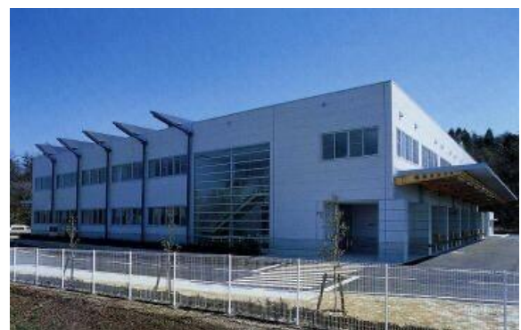
瑞浪市学校給食センター