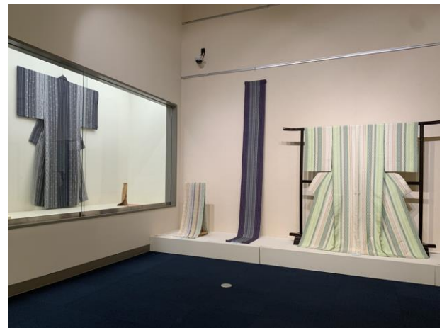
展示風景（企画展示コーナー）