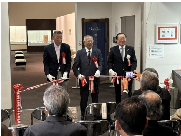
開会式（テープカット）

「特別展『美濃近代窯業の開拓者 曾根磁叟園製陶所』」2025『JAPPI NEWS LETTER』No.308 日本陶磁器産業振興協会