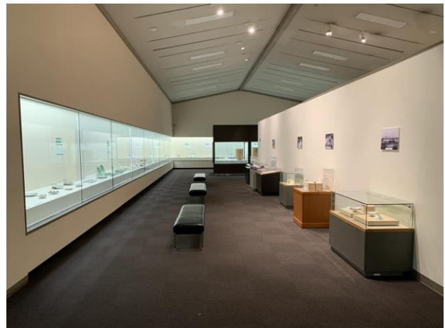
展示風景（常設展示室）