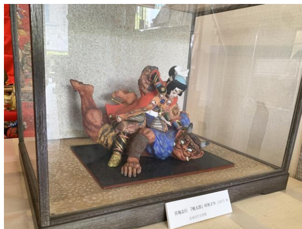
展示品 (宮地志行作「桃太郎」)