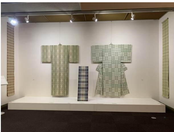
展示風景（常設展示室／協賛出品作品）