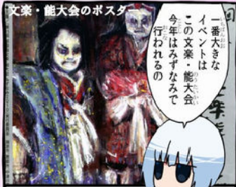
文楽・能大会のポスター