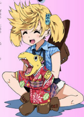
みずなみ市にすみ化石が好きな女の子