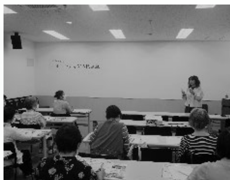
ボランティア入門講座