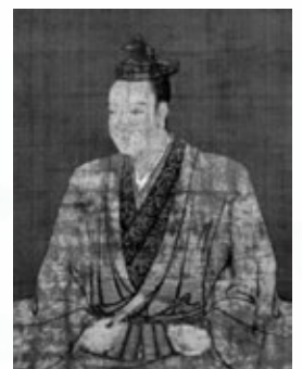
(岸和田本徳寺所蔵)