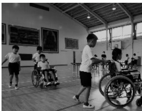
福祉学習出前講座（釜戸小学校）