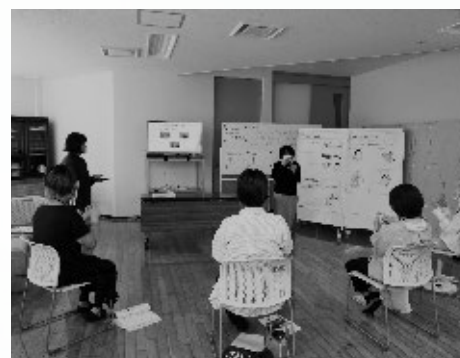
手話奉仕員養成講座