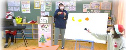
「次は何か出てくるかな？」と子どもたちも興味を持って、楽しんで見ていました！

12月13.14.15.16日に各支援センターでクリスマス会を行いました。すきっぴ+さんに、パネルシアターや手品など楽しい出し物を見せていただき、最後には・・・サンタさんが登場！！子どもたちのサンタさんへの反応が様々で、とても微笑ましかったです。みんなでクリスマスの楽しい雰囲気味わうことができました。