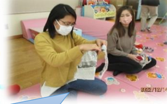
新聞を使ってゲーム♪ママたち真剣です。