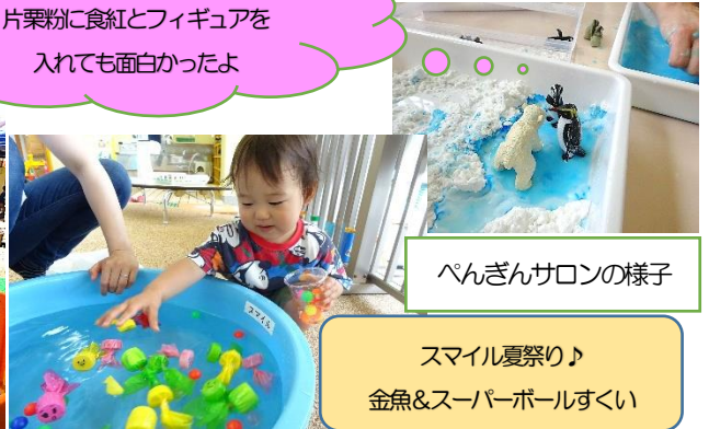
ペンギンサロンの様子