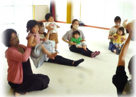
自己紹介&触れ合い遊びタイム