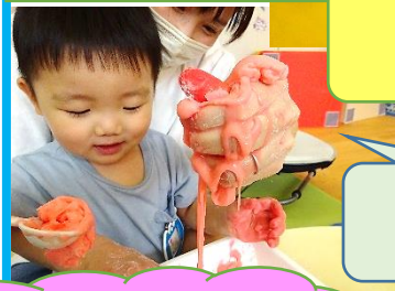
新入りおもちゃ “キネティックサンド”