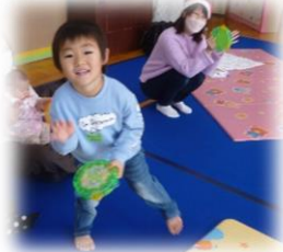
サンタさんにプレゼントをもらったよ!