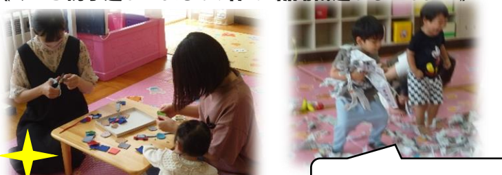
新聞の雨を降らすぞ～!