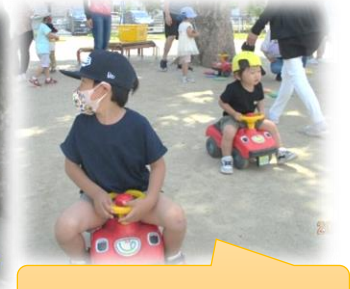
コンビカーで出発！