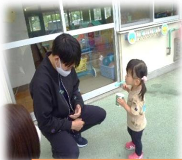
パパとシャボン玉♪