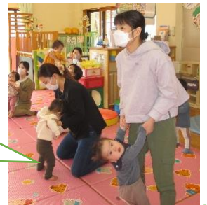
絵本の「パンダのんびり体操」に合わせてビヨーン♡