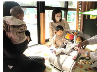
みんなで赤ちゃん見守り隊！