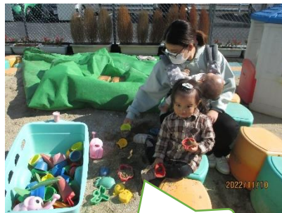
何の形ができるかな？