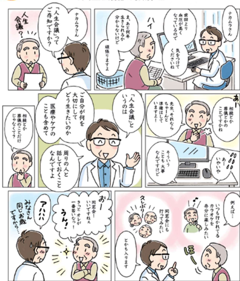
イラスト: 藤田 泰博製子