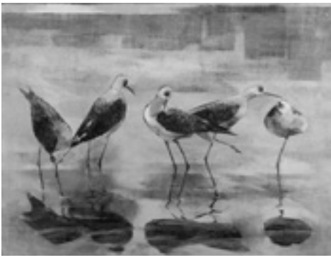
「都会のオアシス(セイタカシギ)」(2002年)