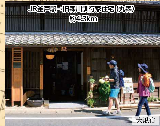
JR釜戸駅→旧森川訓行家住宅(丸森) 約4.3km 大湫宿 JR瑞浪駅から大湫宿へはデマンド交通「いこCar」が便利です。(要事前予約・平日のみ運行・1乗車500円) 詳しくは 瑞浪市デマンド交通 検索

標高五〇〇米 江戸から四七番目 江戸へ九〇里半 大井宿へ三里半 京へ四三里半 細久手宿へ三里半 尾州藩領 山村千村氏知行地 宿高〇九石余 加宿村五ヶ村 助郷高八カ村 二万〇九七石