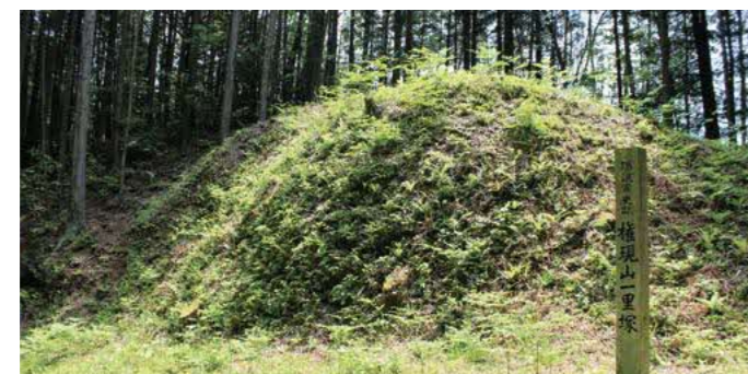
権現山一里塚(櫛の木坂)