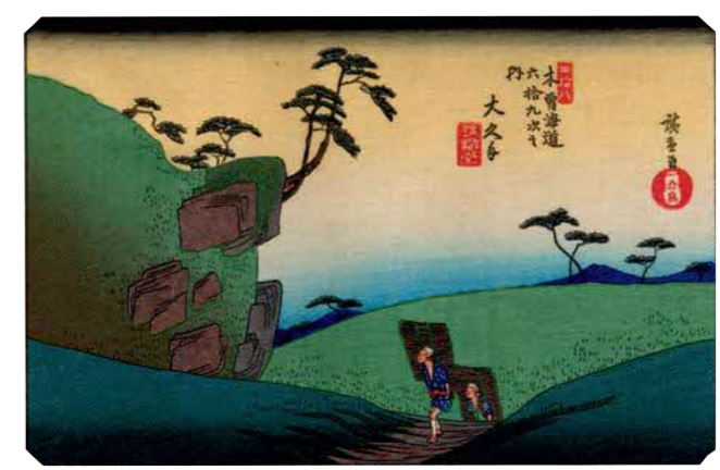
広重画 木曾海道六拾九次 大湫宿