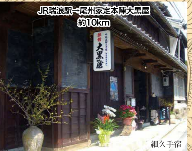
JR瑞浪駅→尾州家定本陣大黒屋 約10km 細久手宿 JR瑞浪駅から細久手宿へはデマンド交通「いこCar」が便利です。(要事前予約・平日のみ運行・1乗車500円) 詳しくは 瑞浪市デマンド交通 検索

標高四三〇米 江戸から四八番目 江戸へ九里 大湫宿へ三里半 京へ四二里 御嶽宿へ三里 尾州藩領 山村氏知行地 宿高無高 加宿村五ヶ村 助郷高二カ村 二万・四三石