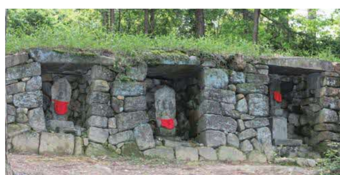
秋葉坂の三尊石窟