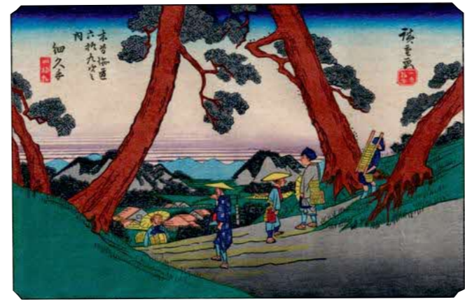
広重画 木曾海道六拾九次 細久手宿