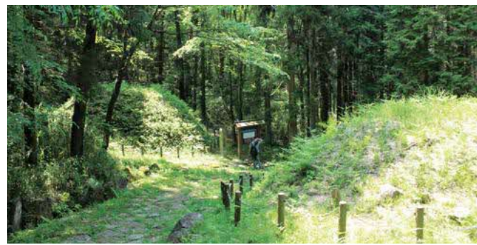
八瀬沢一里塚(琵琶峠)