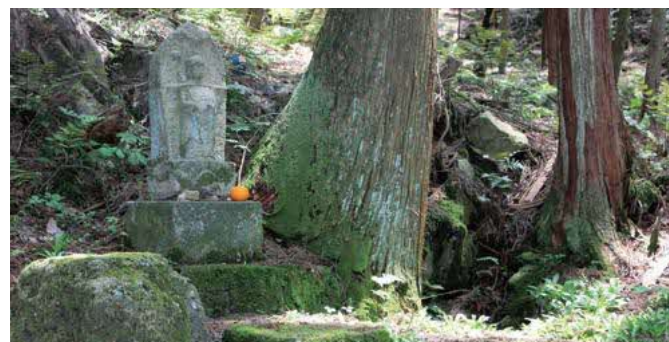
お助け清水・尻冷やしの地蔵様